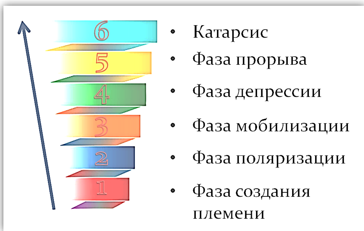
Рисунок 4. Спираль развития сетевой встречи

Спираль развития сетевой встречи (Рисунок 4) - это метафора группового процесса, которая впервые была выделена и описана Россом Спеком и Кэролин Этнив (1973). Они заметили, что когда люди, которые были знакомы и имели одинаковые проблемы, встречались, то во время таких встреч можно было выделить определенный процесс. Этот процесс, несмотря на то, что люди были разные и проблемы тоже разные, повторялся раз за разом. Они рассматривали сетевой процесс как движение, похожее на спираль. Движение проходило через шесть фаз, которые повторялись каждый раз, когда заинтересованные люди собирались вместе, чтобы решить совместную проблему. Если встреча с ближайшим окружением проходит в полную силу, то обычно она проходит следующие стадии группового процесса: «воссоздание племени» - «поляризация» - «мобилизация» - «депрессия» - «прорыв» - «катарсис». Ниже мы приведем короткое описание шести фаз спирали развития встречи, а потом их более подробно прокомментируем на примере конкретных случаев.